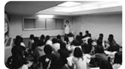
ミーティングで被災された方の話を聞く生徒 まうあでて援方め議会た実な ましごりあるのが々多会福の現活 うたざがるとのことあくのくを社のもで動 °たいと支の初協社き

〈参加者の感想〉 * 今回のボランティアで、私は皆で力を合わせれば、どんなにしんどい事でもいつかは終わる、ということをやりました。 * 実際にボランティア活動をしていると、服や写真、血、ノートなどいっぱい物がありました。今まで平和に暮らしていた生活が一気に変わってしまったんだと改めて思いました。知らされました。 * このボランティアを通して、先輩と話すことができ、よかったです。