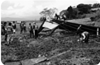
プレハブの屋根を撤去したり草むきをする様子のたっりである中路え動問よ。てか静生ては、たをの2うこいえま徒眠疲車帰終活日

高砂市内にある県立松陽、高砂南の3校の生徒が、夏休みを利用して宮城の復興ボランティアに出かけた。8月9日、12日に活動を実施した。高砂、高砂南両校に先んじて、本校では同日3日、6日、全日、定時制の生徒51名が「活動」を持って参加した。参加者は、出発までに募金活動を行った。校内外で研修会を開いた。ボランティアの目的、心構えを身に付け、残った生徒たちは寄せ書きに復興の願いを記し、2千8百羽に及ぶ折鶴に思いを込めた。また、出発当日には有馬高校生の育てた花を受け取り、多くの人の温かい心を伝える役割を担うこととなった。 現地では気仙沼市復興ボランティアセンターの指示のもと、二手に分かれて活動した。漁網の片付け、被災家屋の泥出し、離島の島での瓦礫撤去、草むき等、強い陽射しの中、休む時間を惜しみながら一心不乱に奉仕作業を続ける生徒たちの姿があった。