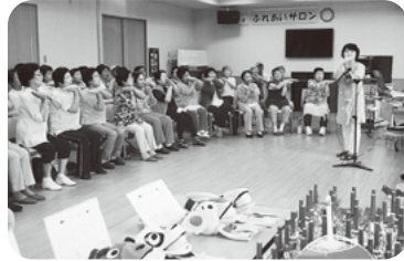
◆伊保町 伊保中部福祉部会(7月13日) 音楽療法士を招いてリズムに合わせた 体操や合奏を楽しんだ後、茶菓子で談笑