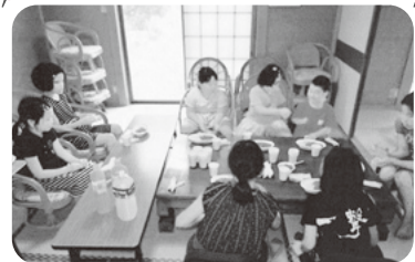
◆北浜町 牛谷団地福祉部会(7月28日) 輪投げ・ダーツを通じ3世代交流を行 い、昼食はカレーを頂き楽しく過ごす

紙面の都合上、一部の活動のみ掲載しています。この他にも、活動されている地区がたくさんあります。ぜひ、お近くのいきいきサロン等へご参加ください。