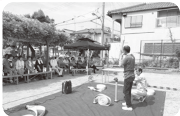
◆阿弥陀町 魚橋北福祉部会(7月2日) 災害を想定した防災訓練を通じ、地域 の各組織の連携の必要性を再確認