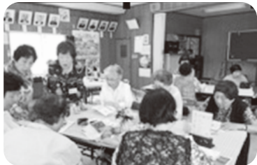
◆米田町 島福祉部会(7月14日) 折り紙やお手玉遊びの後、飲み物とお菓 子を頂きながら楽しいひとときを過ごす