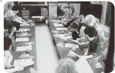
◆米田町 古新福祉部会(7月1日) 脳トレ等で頭の体操をした後、コーヒ ータイムで和やかなひとときを楽しむ