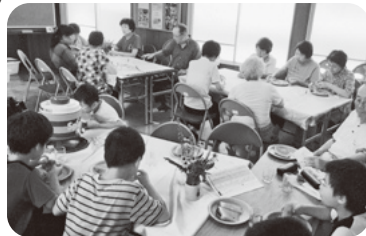
◆阿弥陀町 中西福祉部会(7月31日) 子供会の協力のもとビンゴや昼食を 楽しみ、世代間交流で親睦を深める