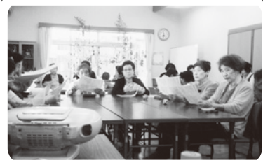
◆伊保町 中島福祉部会(7月1日) 七夕祭りの飾り付け、歌や手遊び、レ クリエーションで楽しく過ごす