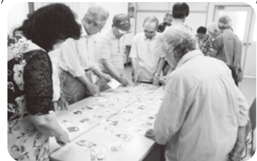
◆阿弥陀町 魚橋南福祉部会(7月8日) 脳トレカルタで頭の体操をした後、玉入れ ゲームで景品を目指し大いに盛り上がる