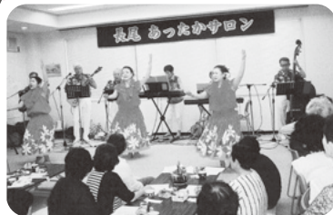
◆阿弥陀町 長尾福祉部会(7月22日) 歌・演奏・フラダンスを鑑賞後、ちらし 寿司やそうめんを頂きながら歓談