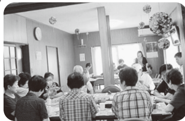
◆中筋校区 中筋一丁目福祉部会(7月8日) 児童を交え、短冊に願いを込めて笹に飾り 付け、七夕祭りで世代間の交流を深める