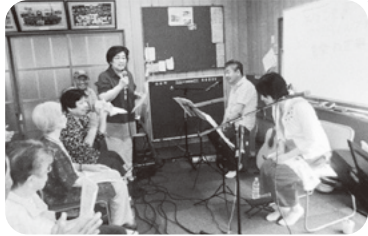
◆高砂町 第9福祉部会(7月17日) 懐かしいフォークソングで青春時代に 思いを馳せ、感動のひとつときを過ごす

～各地域では、「ふれあいいきいきサロン」や見守りが必要な方への「ゆうあい訪問活動」等が福祉委員や民生委員・児童委員の創意工夫により、活発に行われています。今回は、7月に開催された活動の一部をご紹介します。～