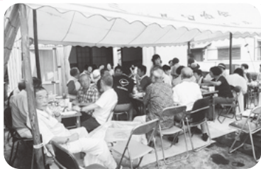
◆伊保町 三ノ島福祉部会(7月16日) 納涼親睦ふれあいビアガーデンを開催、 各々差し入れを持ち寄り、賑やかに歓談