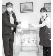
▲生活協同組合コープこうべ

※物品のご寄附は、原則として新品の既成の品物をお願いします。(古着などの回収はしていません)