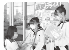
TKV(高砂高校) マックスバリュ梅井店にて街頭募金