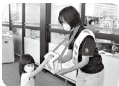
トーホー曾根店にて街頭募金