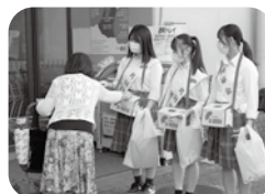
TKV(松陽高校) コープこうべ高砂店にて街頭募金