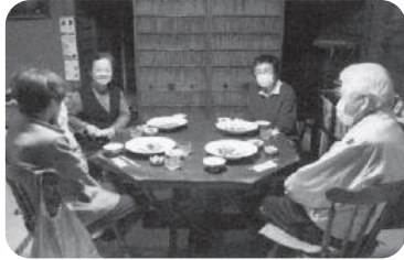
◆高砂町 第3福祉部会(4月5日) 新型コロナウイルス感染症が落ち着き、2年ぶりに懇親会を開催、楽しく交流を深める。

～各地域では、「ふれあいいきいきサロン」や見守りが必要な方への「ゆうあい訪問活動」等が福祉委員や民生委員・児童委員の創意工夫により、活発に行われています。今回は、4月に開催された活動の一部をご紹介します～