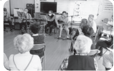
◆荒井町 緑丘福祉部会(4月16日) 介護と防災の講演を聞いた後、「緑丘おっさんバンド」によるライブコンサートを楽しむ。