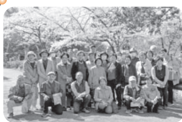
◆阿弥陀町 魚橋南福祉部会(4月9日) 「新たんば荘」まで久しぶりの遠出をして、食事会やビンゴゲームで楽しい1日。