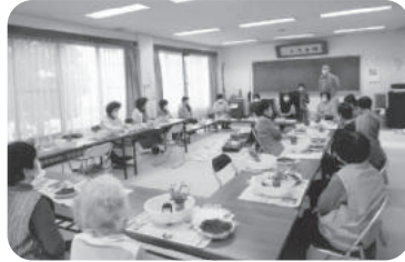
◆荒井町 小松原福祉部会(4月16日) 園芸療法士の指導で苔玉を作り、互いに披露し合い楽しい時間を過ごす。