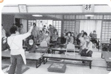
◆伊保町 西部福祉部会(4月12日) コロナフレイル予防の話の後、レクリエーションゲームで「体」と「心」と「頭」をリフレッシュ。