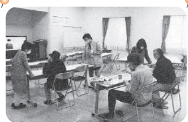
◆北浜町 北脇福祉部会(4月16日) 久しぶりにモーニング喫茶を開催、サンドイッチや飲み物を頂き談笑。

新型コロナウイルス感染防止対策をして実施いただいています。紙面の都合上、一部の活動のみ掲載しています。