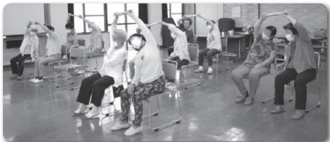
▲わきあいあいサロン@北浜公民館