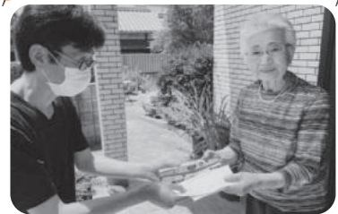
◆伊保町 伊保東部福祉部会(5月29日～6月5日) 挨拶文とクレラップを持参して見守りを兼ね高齢者宅を訪問、皆さんに喜んでいただく。