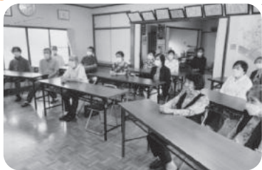
◆荒井町 若宮福祉部会(6月18日) 「元気宣言!おおらか生活」DVD鑑賞の後コーヒートケーキを頂き、福引を行う。

～各地域では、「ふれあいいきいきサロン」や見守りが必要な方への「ゆうあい訪問活動」等が福祉委員や民生委員・児童委員の創意工夫により、活発に行われています。今回は、5月～7月に開催された活動の一部をご紹介します～