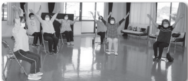
▲わきあいあいサロン@阿弥陀公民館