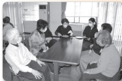
▲わきあいあいサロン@中筋公民館