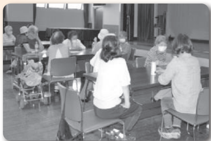
▲わきあいあいサロン@中央公民館

9月15日の「老人の日」から21日の「老人週間」は、老人の福祉への関心と理解と、老人が自らの生活の向上に努める意欲を促すために設けられたものです。