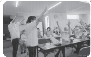
◆阿弥陀町 北池福祉部会(5月29日) 座ったままで手足の簡単な体操をした後、「やすし、きよし漫才」DVD鑑賞やカラオケで楽しく過ごす。

新型コロナウイルス感染防止対策をして実施いただいています。紙面の都合上、一部の活動のみ掲載しています。