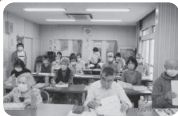
◆荒井町 紙町・紙町労金福祉部会(6月15日) まちづくり出前講座でハザードマップの見方や「マイ避難カード」の作成についての講話を聴く。