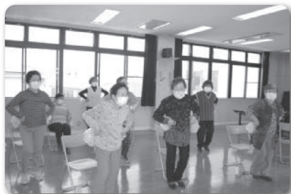
▲わきあいあいサロン@曾根公民館