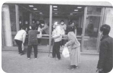
◆伊保町 梅井福祉部会(6月8日) 自治会館前で皆さんの元気な顔を拝見しながら話をお聞きし、くじ引きでお菓子をお渡しする。