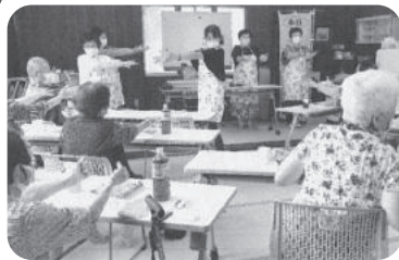
◆米田町 島福祉部会(7月8日) 簡単な体操で体をほぐした後、セタミニコンサートやティータイム等で楽しいひと時を過ごす。