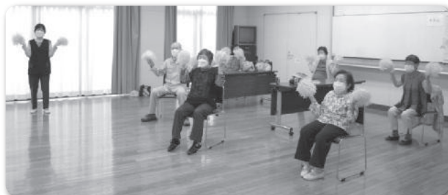
▲わきあいあいサロン@米田公民館