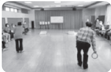
◆曾根町 曾根東之町福祉部会(11月24日) 輪投げ大会を行い大盛り上がり、楽し く笑える時間を共有する。