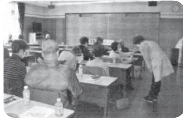
◆高砂町 第5福祉部会(2月11日) 貝殻にペイントしたり、ビーズを張り付 けたりしてキーホルダーを作成する。