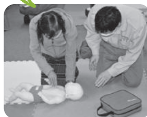
提供・両方会員フォローアップ講座 「乳幼児の救急処置」

子どもの送迎や預かりをお願いしたい時はありませんか? リフレッシュしたい時にも、気軽にお問合せください。 交流会やセミナーなども開催していますので、ぜひご参加ください。