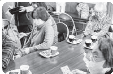
◆阿弥陀町 中西福祉部会(2月27日) お弁当と菜の花のお吸い物で近づく春を 感じながら、ひな祭の思い出を話題に歓談。