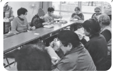
◆中筋校区 春日野団地福祉部会(1月16日) 紙粘土で干支兔を作成し、サンドイッチ とコーヒーのモーニングセットを頂く。