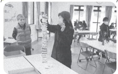
◆北浜町 北脇福祉部会(2月19日) 喫茶北脇を開催、脳トレプリントに挑戦したり、牛乳 パック積みで盛り上がり、楽しい時間を過ごす。

新型コロナウイルス感染防止対策をして実施いただいています。紙面の都合上、一部の活動のみ掲載しています。