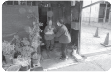
◆高砂町 第2福祉部会(11月14日) お弁当を配付しながら、振り込め詐欺 について注意喚起を呼びかける。

～各地域では、「ふれあいいきいきサロン」や見守りが必要な方への「ゆうあい訪問活動」等が福祉委員や民生委員・児童委員の創意工夫により、活発に行われています。今回は、11月～3月に開催された活動の一部をご紹介します～