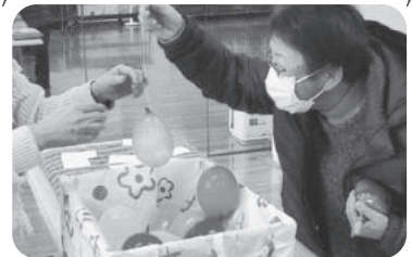
◆米田町 アーバン福祉部会(12月23日) カード絵合わせと風船つりで、クリスマス くじ引きを行い、頂いたプレゼントに笑顔。