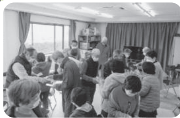
◆荒井町 小松原団地福祉部会(3月4日) 元気になる楽しいレクリエーション ゲームで盛り上がり、交流を深める。