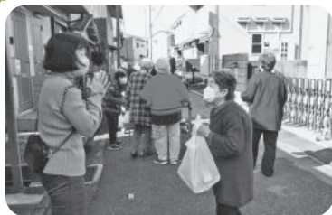
◆阿弥陀町 西下台福祉部会(11月21日) 自治会館までお弁当を取りに来てい ただき、近況をお伺いする。