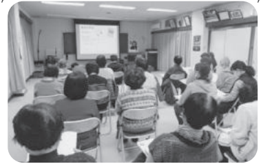
◆荒井町 小松原福祉部会(2月18日) 日記やスケジュール帳を組み合わせた「おと なのお帳面」を配付し、使い方の説明を聞く。