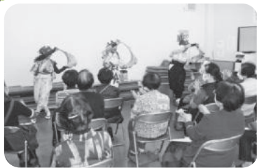
◆荒井町 緑丘福祉部会(3月11日) 「西部病院」のフレイル講演受講後「南京玉す だれ同好会」による5種類の妙技に拍手喝采。