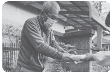
◆曾根町 曾根南之町福祉部会(2月26日) 戸別訪問をしてマスクを配付、近況を お聞きしながら交流を図る。