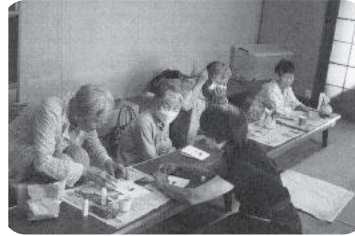
◆高砂町 第5福祉部会(7月29日) オリジナル紙袋の作成と世間話で、笑顔あふれる時間を過ごす。