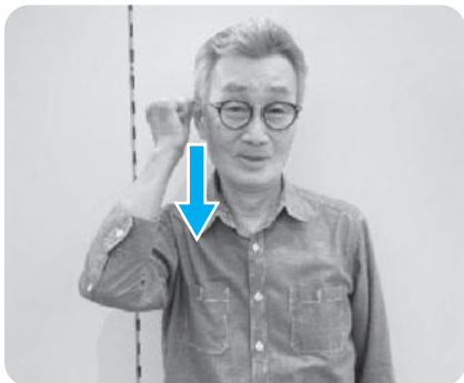
※「おはよう」 グーの右手をこめかみから下におろす。

大切なのは、相手の目を見ること。また、表情がとても重要です。にっこり微笑んで、相手の目を見て「こんにちは～!」と明るく元気に表現しましょう。