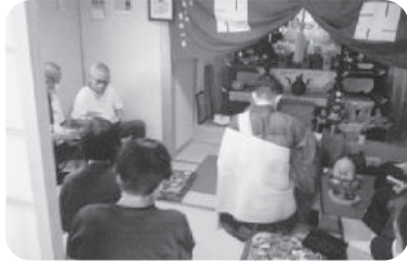
◆高砂町 第4福祉部会(8月22日) 地藏盆を開催。お寺さんからのお話の後、食事会を行い有意義な時間を過ごす。

～各地域では、「ふれあいいきいきサロン」や見守りが必要な方への「ゆうあい訪問活動」等が福祉委員や民生委員・児童委員の創意工夫により、活発に行われています。今回は、6月～8月に開催された活動の一部をご紹介します～