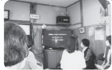
◆米田町 米田新福祉部会(6月28日) 高砂警察署講師による自転車安全教室を開催。ヘルメット装着についての講話の後、お茶をいただきながら談笑を楽しむ。