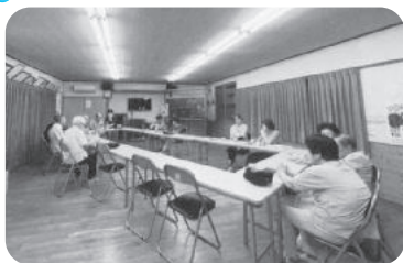
◆米田町 美保里福祉部会(8月1日) お友達を誘いあって、喫茶を開催。顔なじみの方たちと和気あいあいとした時間を過ごす。