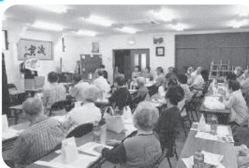
◆阿弥陀町 阿弥陀東福祉部会(7月16日) 「エンターテイメントチェリー」による見事なマジックと腹話術、皿回しを笑顔で見入り、大盛り上がり。