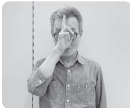
※「こんにちは」 チョキの右手をおでこにあてる。