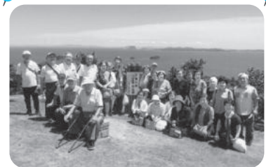
◆北浜町 牛谷団地福祉部会(7月20日) 参加希望者を募り、万葉唄へ。食事後のビンゴゲームや道の駅での買い物など、楽しい一日を過ごす。

新型コロナウイルス感染防止対策をして実施いただいています。紙面の都合上、一部の活動のみ掲載しています。