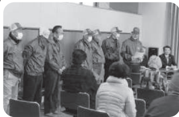
◆曾根町 曾根東之町福祉部会(1月13日) 「防災リーダーたかさご」による講演会を開催。防災の意識を高め、今できる対策をともに考える。