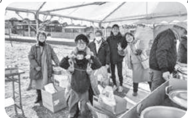
◆阿弥陀町 中所福祉部会(1月13日) 恒例のとんどを開催。手作りぜんざい、おでん、豚汁をいただき、子どもから高齢者まで賑やかに過ごす。