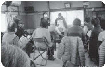
◆米田町 米田新福祉部会(1月17日) 体操の後、「ヤクルト」によるおなかの健康についてお話を聞き、理解を深める。