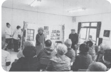
◆高砂町 第8福祉部会(2月11日) 「わすれな草」による認知症予防劇と綾小路きみまろのDVDを鑑賞し、みんなで大笑い。

～各地域では、「ふれあいいきいきサロン」や見守りが必要な方への「ゆうあい訪問活動」等が福祉委員や民生委員・児童委員の創意工夫により、活発に行われています。今回は、1月～2月に開催された活動の一部をご紹介します～