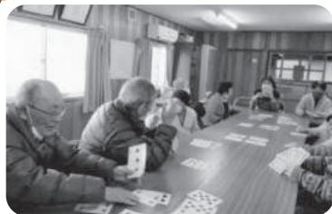
◆阿弥陀町 山ノ端福祉部会(1月15日) ババ抜きと坊主めくりで対決。応援にも力が入り、大盛り上がり。