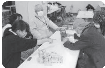
◆米田町 アーバン福祉部会(1月26日) ジェンガ、カルタ取り、輪投げなど、和気あいあいと楽しい時間を過ごす。