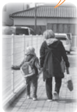
～依頼会員の子どもを送迎する提供会員～