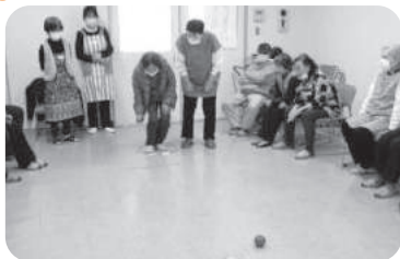
◆阿弥陀町 魚橋南福祉部会(2月10日) 6チーム対抗パタンク大会を開催。戦略を練り、体を動かし、賑やかに過ごす。