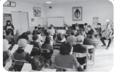
◆伊保町 伊保東部福祉部会(2月11日) 関西福祉大学吹奏楽団による演奏を聴き拍手喝采。手作りカレーをいただき、学生たちとの会話も楽しむ。