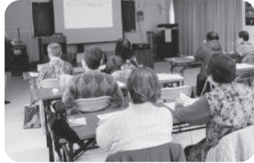
◆荒井町 小松原福祉部会(2月17日) 行政書士による講話で、契約や遺言などについて理解を深めた後、昼食を楽しむ。