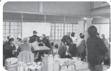
◆曾根町 曾根北之町福祉部会(1月21日) モーニングをいただきながら、顔なじみの方とも話が盛り上がり、楽しく交流を深める。