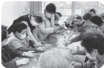
◆中筋地区 春日野団地福祉部会(1月22日) 先生のご指導のもと、みんなで楽しく干支づくり。お茶菓子もいただき、賑やかに過ごす。