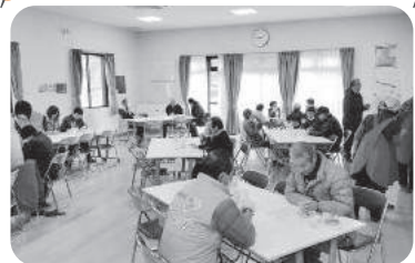
◆北浜町 北脇福祉部会(2月17日) おいしいモーニングで体も温まり、脳トレ、牛乳パック積み、囲碁、将棋を楽しむ。

紙面の都合上、一部の活動のみ掲載しています。このほかにも、活動されている地区がたくさんあります。ぜひ、お近くのいきいきサロン等へご参加ください。