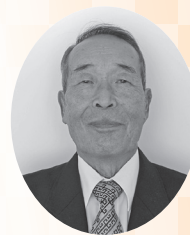
高砂市社会福祉協議会