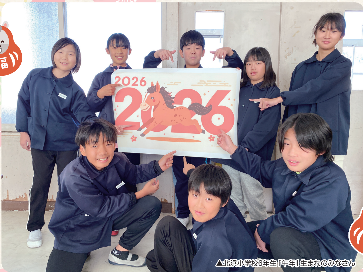
△北浜小学校6年生「午年」生まれのみなさん