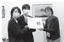
◀兵庫県立高砂高等学校 生徒会・ ジャズバンド部・調理部・PTA