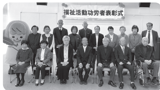
▲受賞者(出席者)の皆さま