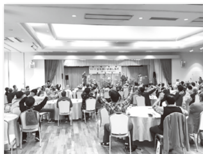
▲ふれあいお楽しみ会