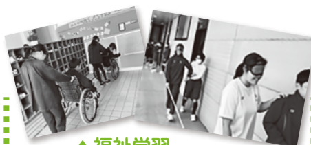
▲福祉学習 (車いす・白杖体験)

各種レクリエーション器材や車いすの無料貸し出しを行っています。お気軽にご相談ください。