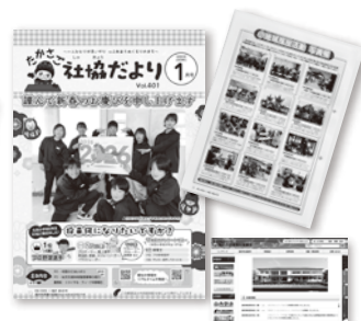
▲広報活動 (ボランティア情報や各種事業の最新情報を掲載しています)