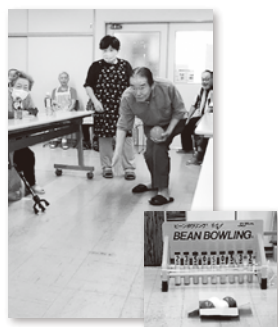
▲レクリエーション器材 を活用したサロン活動

普通会費の40%を地域に還元し、住民の皆さまがご自身の地域で取り組む福祉活動に活用されています。