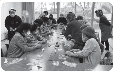
◆中筋校区 春日野団地(1月19日) みんなで馬の干支を作ったり、お茶を飲んだりしてワイワイ楽しく過ごす。