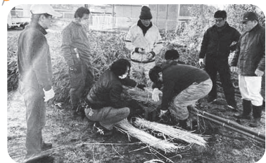
◆阿弥陀町 北山(1月12日) みんなで力を合わせてとんどの準備から片付けまでを実施。地域交流のよい機会となる。

紙面の都合上、一部の活動のみ掲載しています。このほかにも、活動されている地区がたくさんあります。ぜひ、お近くのいきいきサロン等へご参加ください。