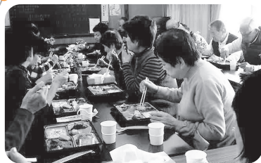
◆米田町 米田新(11月26日) コスモス食事会。今月誕生日の人を祝い、弁当を囲んで楽しくお喋りし交流を深める。