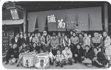
◆伊保町 三ノ島(1月24日) 「体験」をテーマにふれあいバス旅行。いちご狩りやちくわ作りなど、色々な体験を楽しむ。