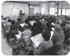
◆伊保町 梅井(12月2日) 児童合唱団の先生を招き、みんなで合唱。心温まるひとときを過ごす。

～各地域では、「ふれあいいきいきサロン」や見守りが必要な方への「ゆうあい訪問活動」等が福祉委員や民生委員・児童委員の創意工夫により、活発に行われています。今回は、11～2月に開催された活動の一部をご紹介します～