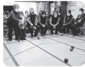
◆中筋校区 春日野町(2月2日) ポッチャ大会で脳と身体のエクササイズ。3チームによる対戦で、白熱した盛り上がりとなる。