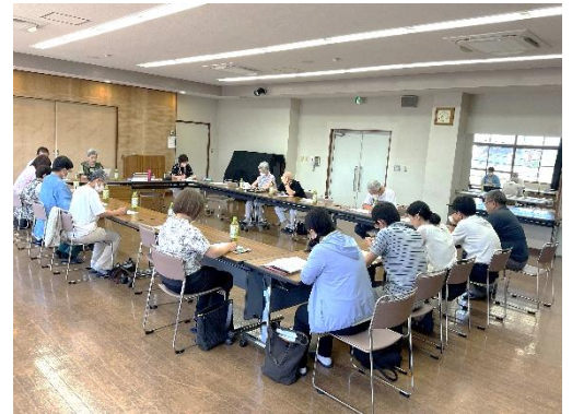
(支え合いづくり協議会 役員会の様子)

福祉推進委員会、連合自治会、民生委員・児童委員会、老人クラブ、介護事業所(常寿園・のじぎくの里)、播磨薬剤師会で構成されています。