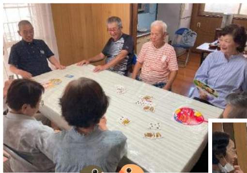
よろずカフェ (中筋一丁目)