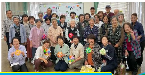
折り紙教室 (小物入れ作り)