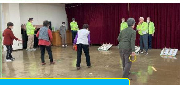
老人クラブ合同輪投げ大会