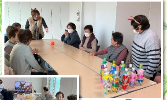
めくもい (中筋西 いきいきサロン)