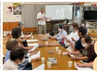
時光寺町 老人クラブ