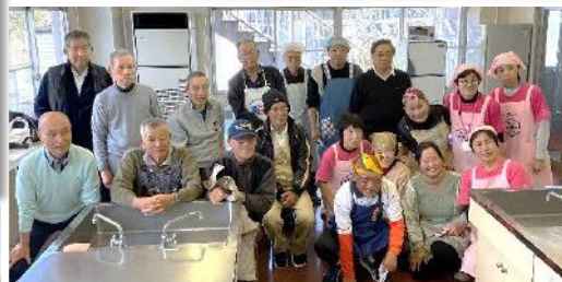
男性のためのフレイル予防料理