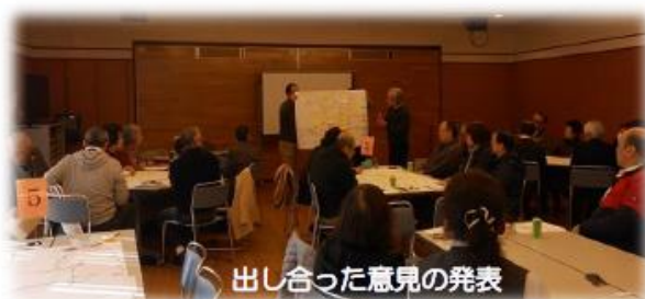
出し合った意見の発表

参加者で4グループに分かれてワークショップを行いました。今回は、高砂町のお宝探しを行い、地域の資源に気づき、それを参加者で共有しました。ワイワイがやがやと参加者で出し合った意見は合計102もありました。（裏面に抜粋掲載）