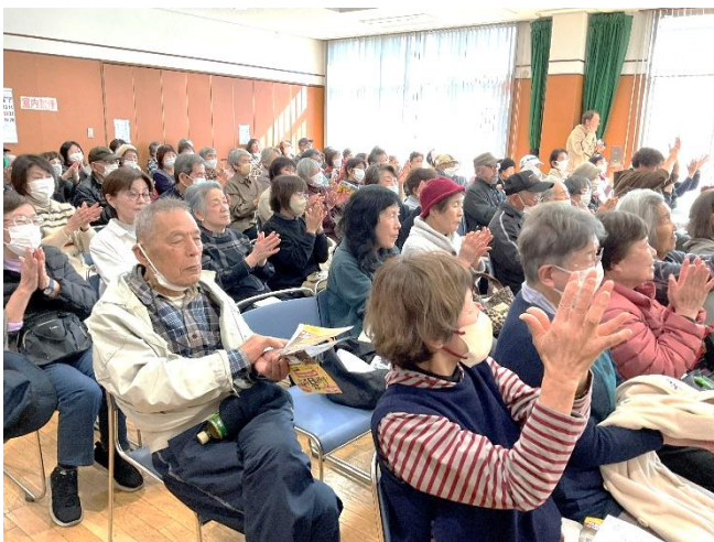
高砂町ふれあいサロン(R8.3.1取材)