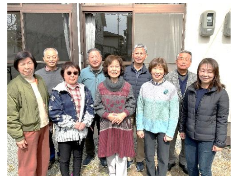
アサヒ元気ハツラツ・グループ

支援は一方的ではなく、依頼者にも役割を担っていただくなどして自立生活を手助けしていきます。立ち上がったばかりですが、「出来ることを出来る範囲で」をモットーに進めていきたいと考えています。