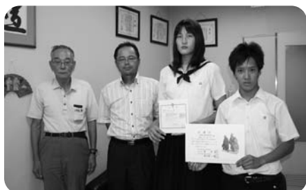
高砂高校生徒会・ジャズバンド部・PTA