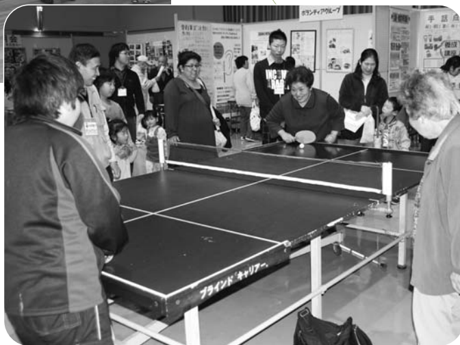
▲ボランティア体験・福祉見聞スタンプラリーの様子