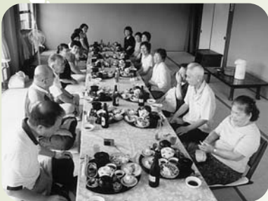
▲荒井町小松原団地福祉部会 こまだんいきいきサロン(9月13日)