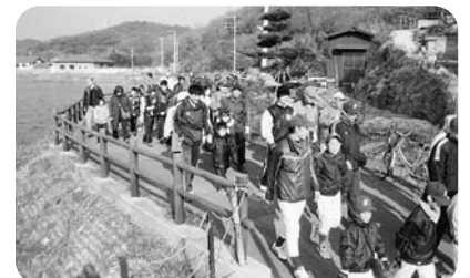
▲世代間交流事業 （新春ふれあいハイキング）