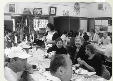
▲北浜町牛谷東福祉部会 いきいきサロン21(8月1日)