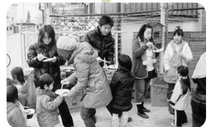
▲世代間交流事業（三世代交流会）