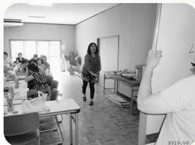
▲阿弥陀町魚橋北福祉部会 ふれあいサロン(8月26日)