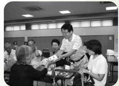
▲曾根町東之町福祉部会 おしゃべりサロン(9月9日)