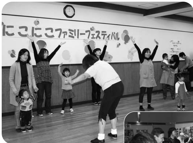
▲にこにこファミリーフェスティバルの様子