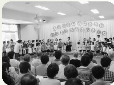
▲伊保町伊保東部福祉部会 ふれあいのつどい(9月9日)