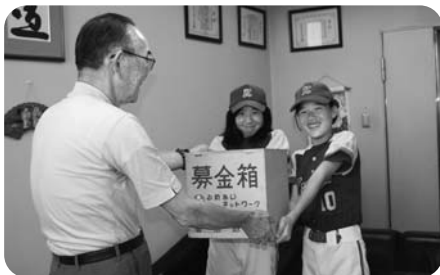
高砂少女ソフトボール連盟