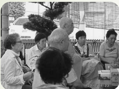
▲米田町美保里福祉部会 ぎんなんの会(8月23・24日)