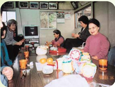
▲米田町古新福祉部会 ふれあい食事会 (11月17日)