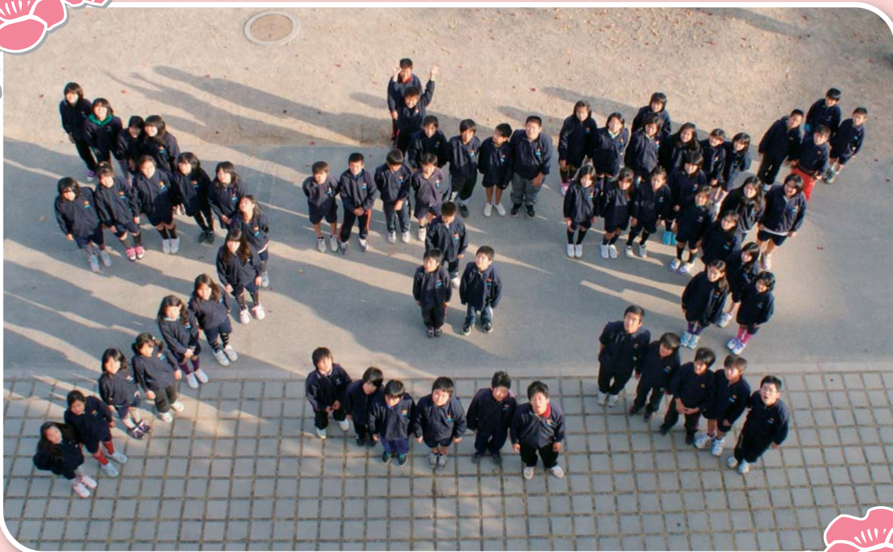
▲ 中筋小学校6年生「卯年」生まれの児童