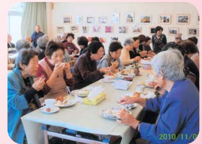
▲北浜町西浜福祉部会 寿々の会 (11月6日)