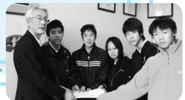
竜山中学校▷ (カルチャーハウスBEY トライやる生一同)