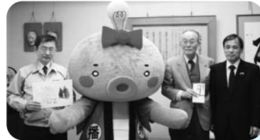
◀ J-POWER電源開発(株)高砂火力発電所