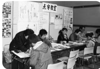
ここにこ ファミリーフェスティバル