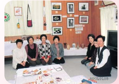
▲伊保町三ノ島福祉部会 ふれあい会 (11月6日)