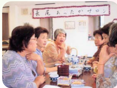
▲阿弥陀町長尾福祉部会 あったかサロン (10月12日)