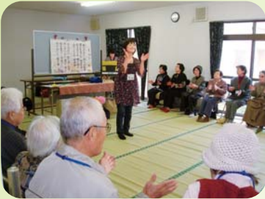
▲高砂町第8福祉部会 ふれあい高齢者のつどい (11月14日)