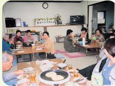
▲荒井町蓮池福祉部会 お好み焼きパーティー (10月25日)