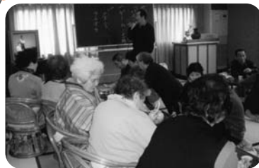
◆中筋校区 中筋東福祉部会(1月30日) サイコロを使ったゲーム・新年交歓会を兼ねた食事会