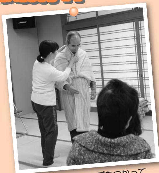
▲毛布とガムテープをつかって ガウンをつくりました