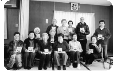
◆伊保町 伊保中部福祉部会(1月26日) 干支のうさぎの押し絵色紙を作成