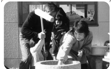
◆阿弥陀町 魚橋福祉部会(1月8日) 新春餅つき大会