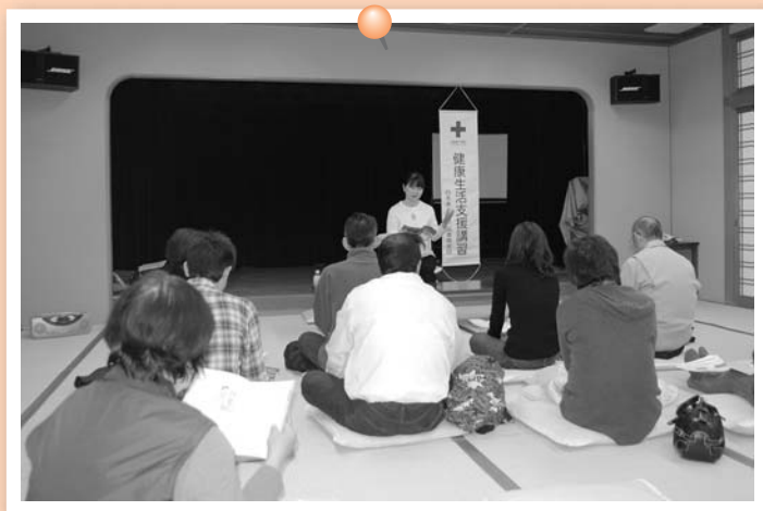
▲講師の先生からテキストをつかった 講習と実技を学びました