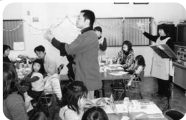
◆伊保町 タクマ福祉部会(12月5日) 三世代交流クリスマス会で大盛り上がり