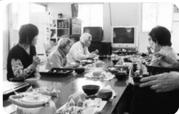
◆米田町 古新福祉部会(1月19日・2月16日) 食事会～綾小路きみまろのビデオを見て大爆笑～