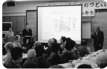
◆高砂町 第5福祉部会(11月13日・1月15日) ふれあい会食会(11月13日)、新年の集い(1月15日)