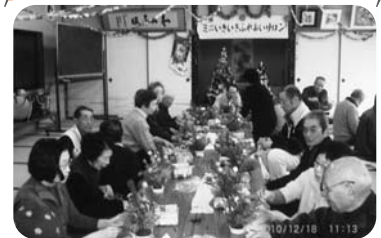
◆曾根町 南之町福祉部会(12月18日) お正月用のミニ生花作り・手品に大喝采