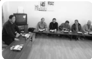
◆阿弥陀町 西下台福祉部会(1月17日) 食事とカラオケで新年会