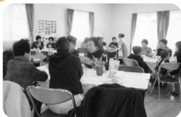
◆北浜町 北脇福祉部会 (1月22日) 西浜と牛谷団地の福祉委員も参加して喫茶で交流会

紙面の都合上、一部の活動のみ掲載しています。この他にも、活動を実施されている地区がたくさんあります。ぜひ、お近くのいきいきサロン等へご参加ください。