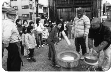
◆高砂町 第2福祉部会(1月9日) 三世代ふれあい餅つき

～各地域では、「ふれあいいきいきサロン」や見守りが必要な方への「ゆうあい訪問活動」等が福祉委員や民生委員の創意工夫により、活発に行われています。今回は、11月から2月に開催された活動の一部をご紹介します。～