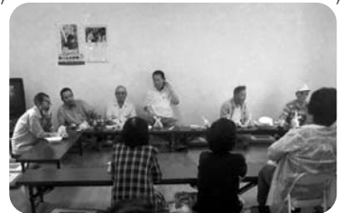
◆阿弥陀町 西下台福祉部会(7月18日) そうめんを食べながらおしゃべり会