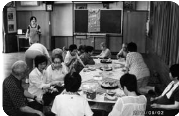
◆米田町 美保里福祉部会(8月2日) 手作りのカステラとアイスコーヒーを飲みながらおしゃべり喫茶