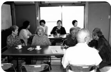
◆曾根町 北之町福祉部会(9月10日) ふれあい喫茶を開催し、コーヒーを飲みながら楽しく歓談