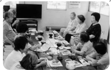
◆米田町 古新福祉部会(9月7日) 食事をしながら、台風についての話題等でおしゃべり会