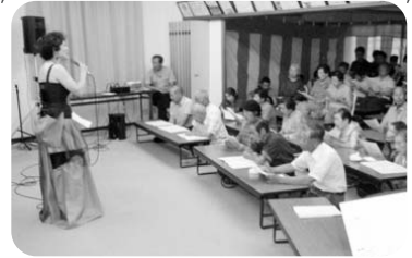
◆伊保町 伊保西部福祉部会(9月19日) 自治会主催の西部敬老会に参加し、シャンソン等を鑑賞