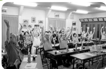
◆阿弥陀町 阿弥陀東福祉部会(8月28日) DVD鑑賞、健康体操、カラオケやかくし芸等で大盛り上がり