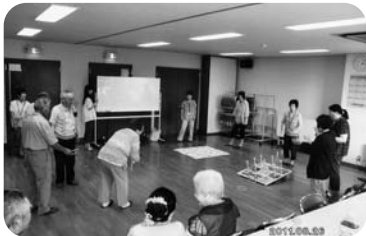
◆米田町 高砂アーバン福祉部会(8月26日) 輪投げとおしゃみ投げのビンゴゲームバージョンで大盛り上がり