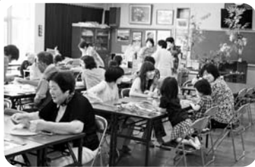
◆米田町 米田福祉部会(7月17日) 子ども達と一緒に七夕祭りの飾り作り