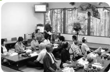
◆阿弥陀町 中所福祉部会(8月3日) 安富町の花温泉へバス旅行し、おいしい料理やカラオケで大盛り上がり