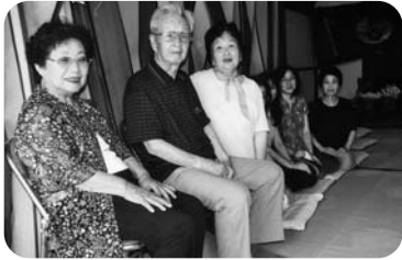
◆高砂町 第3福祉部会(7月23日) 稲荷神社の夏祭りに参加後、お茶菓子を食べながらおしゃべり会

～各地域では、「ふれあいいきいきサロン」や見守りが必要な方への「ゆうあい訪問活動」等が福祉委員や民生委員の創意工夫により、活発に行われています。今回は、7月～9月に開催された活動の一部をご紹介します。～