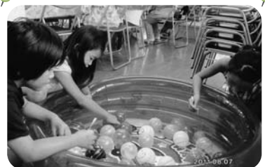
◆北浜町 牛谷東福祉部会(8月7日) ヨーヨー釣りなど七夕祭りも兼ねてモーニングを開催

紙面の都合上、一部の活動のみ掲載しています。この他にも、活動を実施されている地区がたくさんあります。ぜひ、お近くのいきいきサロン等へご参加ください。