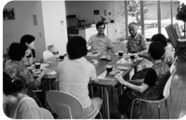
◆高砂町 第6福祉部会(7月10日) モーニングを食べながらおしゃべり会