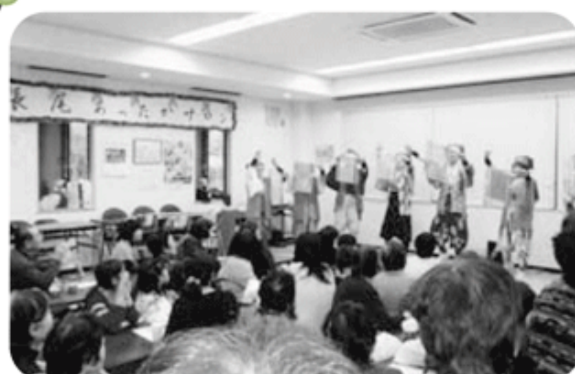
◆阿弥陀町 長尾福祉部会(12月23日) 餅つき大会やクリスマスソングの合唱、南京玉簾等の演芸を楽しみ、子どもとの交流を深める