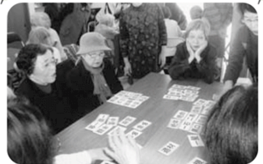
◆伊保町 古沼福祉部会(1月8日) 新年を寿ぎ食事会を開催、たくさんの参加者に会話も弾み、カードゲームで盛り上がる