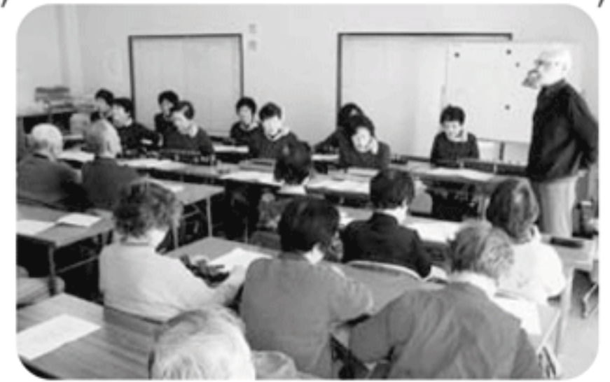
◆荒井町 緑丘福祉部会(12月8日) 大正琴の心ひかれる演奏と共に合唱を楽しみ、勇壮な高砂太鼓に皆大満足