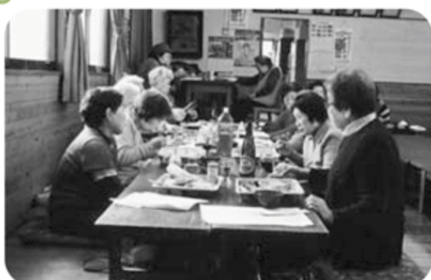
◆米田町 美保里福祉部会(1月6日) 親睦新年会で大いに盛り上がり、ビンゴゲームやカラオケを楽しむ