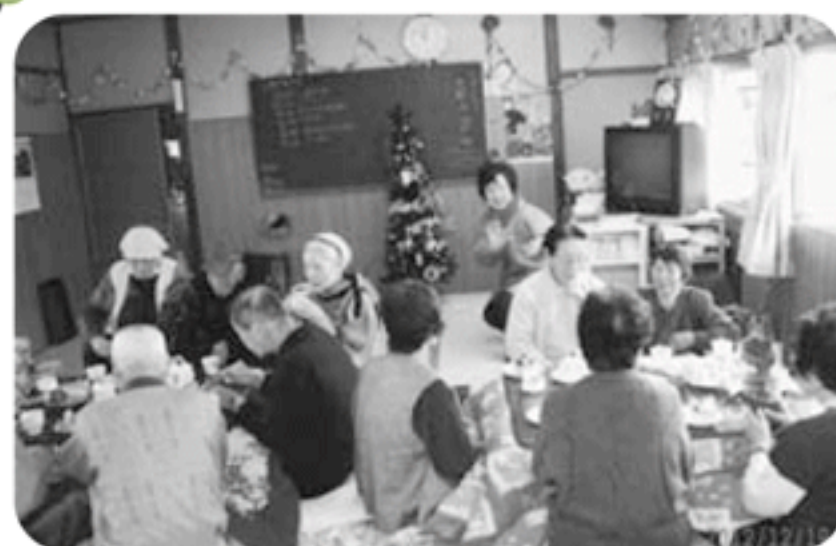
◆米田町 米田新福祉部会(12月19日) 誕生日会とクリスマス会を兼ねて開催、ケーキとコーヒーで楽しい時間を過ごす