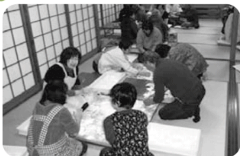
◆曾根町 北之町福祉部会(12月23日) 昔を懐かしく思い出しながら餅つきを楽しみ、美味しいぜんざいを頂く