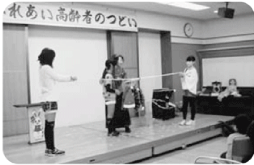
◆高砂町 第1福祉部会(12月15日) 世代間交流会を開催、マジックショーやヴィオラ伴奏での合唱等、老若一緒に楽しく過ごす

～各地域では、「ふれあいいきいきサロン」や見守りが必要な方への「ゆうあい訪問活動」等が福祉委員や民生委員の創意工夫により、活発に行われています。今回は、12月～1月に開催された活動の一部をご紹介します。～