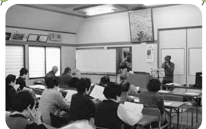
◆北浜町 牛谷福祉部会(1月17日) ウクレレやハーモニカ演奏に合わせた合唱やビンゴゲーム、カラオケ等で楽しいひととき

紙面の都合上、一部の活動のみ掲載しています。この他にも、活動されている地区がたくさんあります。ぜひ、お近くのいきいきサロン等へご参加ください。