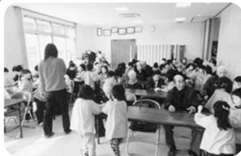
◆伊保町 伊保東部福祉部会(12月14日) 幼稚園児との交流会を開催、高齢者とダンスでふれあい、ジャンケンゲームで大爆笑