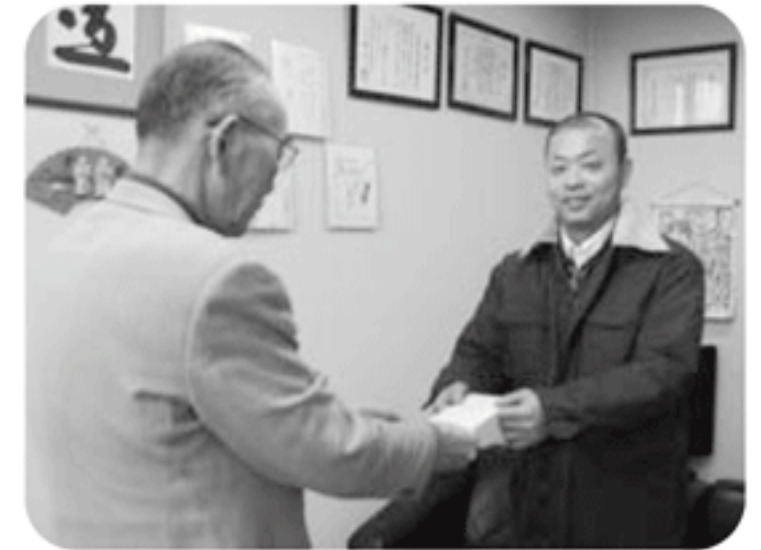
△カネカ労働組合高砂支部