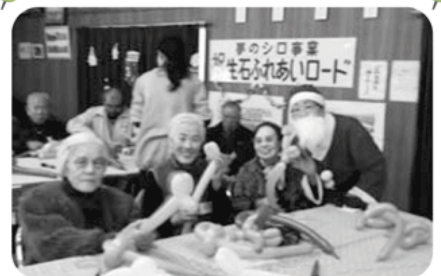
◆米田町 島福祉部会(12月14日) クリスマス会を開催、サンタとトナカイの登場に盛り上がり、バルーンアートにも挑戦