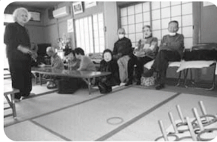
◆荒井町 御旅福祉部会(12月24日) 輪投げやビンゴゲームを楽しんだ後、ケーキを頂きクリスマス気分を味わう