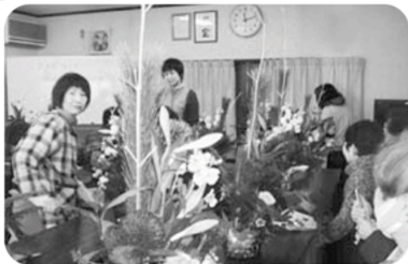
◆荒井町 若宮町福祉部会(12月27日) 講師を迎えてのフラワーアレンジメント、素晴らしい作品で会場が華やかに