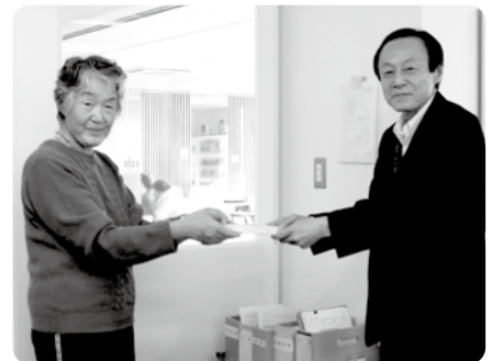
▲高砂市高齢者大学 松陽学園学生自治会

K・T…布地4枚 匿名…肌着5枚、下着2組 匿名…未使用切手 匿名…吸水マット1枚、タオル5箱、タオル5枚、電気毛布2枚、座布団カバー5箱、 レースケット1枚、肌布団3枚、ポアシート3枚、掛布団1枚