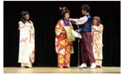
賑やかな仮装でトークにも花が咲く