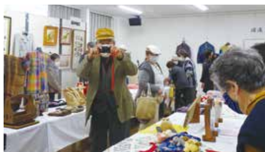
老人クラブの仲間も増えました！

りがとうございました。出展者、来場者、役員事務局の皆様三位一体となつて作品展を終える事ができました。次回もまた参加できますようお願いいたします。皆様本当にありがとうございました。