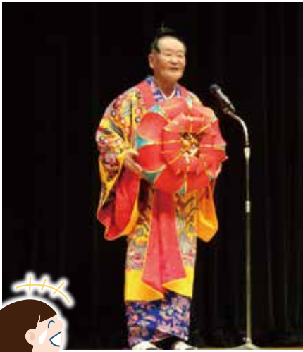
思い思いの仮装で会場は大笑い!