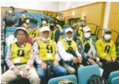
笑いの絶えない健康な一日に！

我がチームも小雨の中、まずは第1チェックポイントを目指して出発、地図を見る者、目標物を探す者、それぞれ役割分担して地図を見ながら和気あいあいと秋の篠山の町並みを散策しながら歩き、無事コースと8か所のチェックポイントを回りゴール地点の篠山市民センターに到着する