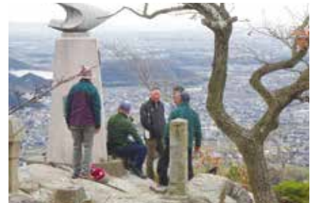
頂上からの景色はまさに絶景！！

け、流れ解散としました。参加者の皆さんの協力により、全員事故もなく無事大会を終える事が出来安堵しています。「明日の筋肉痛心配ですが??？」皆さんまだまだ元氣。市老連パワーに「プロフィール」