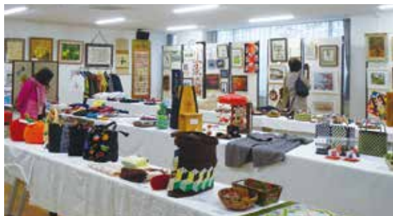
408作品が展示された会場は壮観！

昨年に引き続き開催する事ができました。作品展の主旨は、老人クラブ各地域の皆様の手作り作品を通して親睦を図り新しい発見をする事でした。今回は出展者142名、出展数408点の作品が集まり、全部展示できるか不安の中で作業を開始、試行錯誤しながらなんとかほとんど展示できました。どの作品も素人とは思えないプロ並み