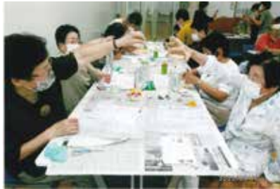
実際に触れてみることで理解が深まる

しかしこの行為が大きな誤算で、設定時間を大きく超過してしまつたことになります。最終結果は42チーム中34番目に…。参加賞の他にも主催