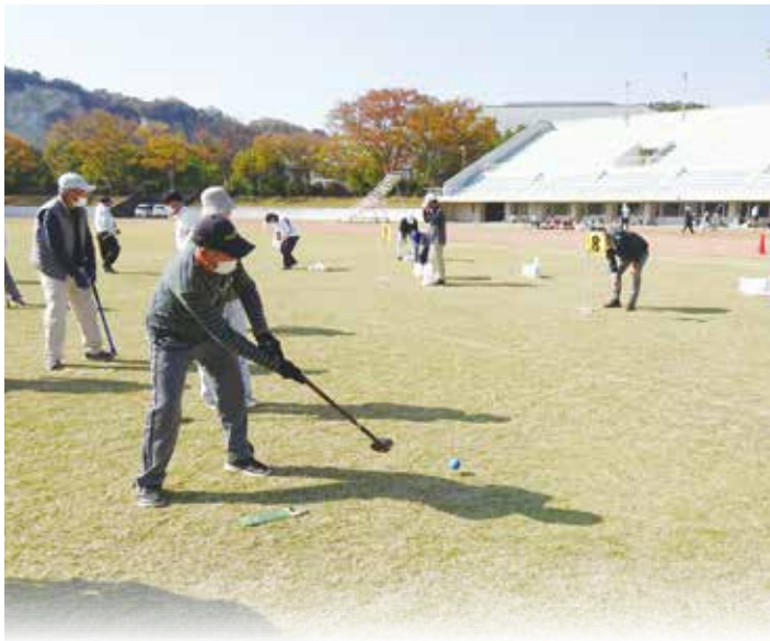
白熱の試合は大盛り上がり！

11月10日、グラウンド・ゴルフ大会が紅葉で取り囲む市陸上競技場で行われました。早朝より、役員の皆様の協力により、会場の設営・競技コートの設定を行い準備完了。選手、応援者の来場を待つのみとなりました。8時30分の受付開