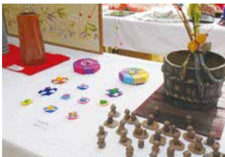
プロ並みの作品が集まりました！