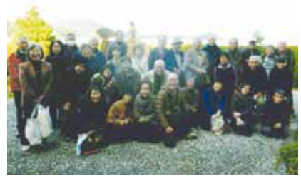
総勢 33 名！とても賑やかな旅行に

阿弥陀町老人会が、初の忘年会を兼ねた旅行を実施しました。 令和4年12月12日、鳥取／冬の味覚「かに会席のご昼食」をメインに早朝8時より総勢33名参加。鳥取までの2時間バスの中は、マスク越しに賑やかでした。