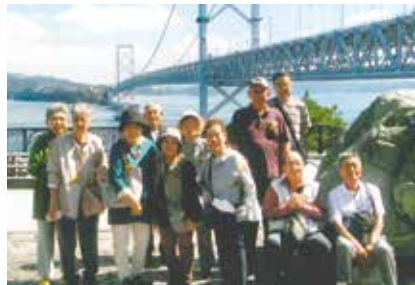
雄大な景観に気分も最高潮！

9月30日、朝から快晴に恵まれ、まさに行楽日和、楽しくなる予感でいっぱい。総勢102名、バス3台でいざ出発。分かれて発車したバスも淡路SAで合流、さあ大鳴門橋に向けて発車オーライ、いよいよ旅の始まりです。