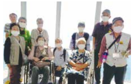
安全安心な旅行を満喫！次回も楽しみ

れいだったなあ。みんながコロナ対策しながら安全に楽しいバス旅行になりました。お疲れさまでした。旅行の楽しさは行かないと分からない、しかも大勢の方が楽しい。次の企画を楽しみにしています。