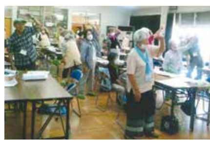
播州弁ラジオ体操を行っています！

米田町老人クラブ（7クラブ）の一応女性部が中心となつて2ヶ月に1回第3土曜日10時～11時30分まで米田第一公会堂で米田仲よしサロンを開催しています。 大体45～50名の皆さまが参加して下さいます。 内容は播州弁ラジオ体操、折り紙、迷路クイズ、日本地図、懐メロ等、毎回プログラムを考えて行っています。