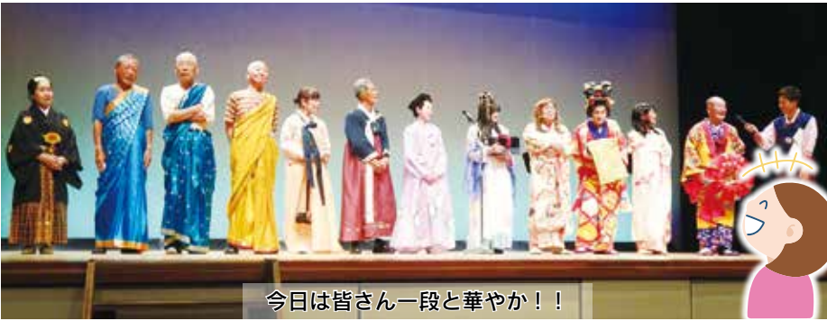
今日は皆さん一段と華やか！！

ショーのコンセプトは「皆で楽しく笑って」を基本にして女性部・若手部常任理事が中心となつて5月から会議を重ねて開演する事ができました。