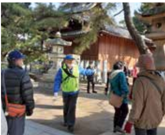
歩いてみて分かる町の歴史！

私が住む曾根町の郵便番号は一つです。こちらは塩田があり、塩の生産積出が主産業でまとまった町づくりになっていた。金持ちの旦那は塩田地主でした。各地域の歴史は現在まで、変化を重ねながらも変わらぬ姿もとどめていると思えました。