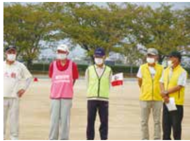
悪天候の中諦めず奇跡の入賞！