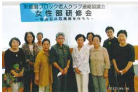
体験を重視した研修会は大成功！

この度の女性部研修会は趣向を変えて物作りを主とした課題に取り組みました。参加者の皆様帰り際にとても良い研修会でしたと声をかけていただきほっといたしました。