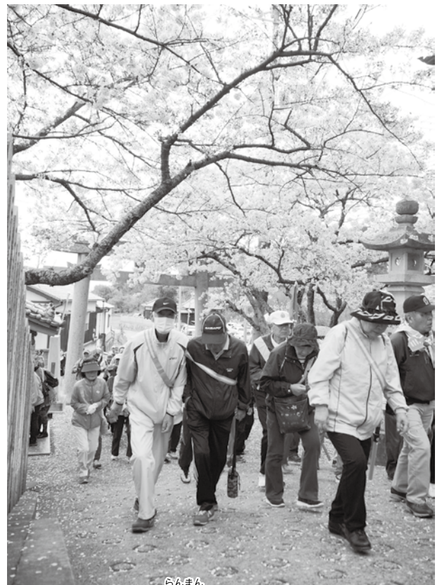
桜花爛漫の春を味わう

〒650-0022 神戸市中央区元町通4-4-8 タイムスビル9F 株式会社ニチコミ編集部「たかさご老連プレゼント係」 お問い合わせは ☎ 078-351-3389 (株)ニチコミプレゼント事務局