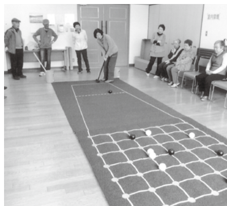
囲碁ボールは人気です