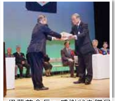
伊藤前会長へ感謝状を贈呈

その後、本年度事業計画を含む各議案が全て承認可決され、平成29年度における高砂市老人クラブ連合会の新たな方針が決定しました。 「高齢者の元気は地域の元気」「地域づくりに貢献しよう老人クラブ」をモットーに、重点施策として「本年度増加目標1単位クラブ2名」「若手、女性部の力を結集し組織の活性化」「シルバーカード事業に皆の力を結集しよう」の3点を掲げて前進していくので、会員のみならずご協力をお願いします。